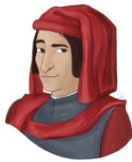
LORENZO IL MAGNIFICO

NEL RINASCIMENTO, A FIRENZE, COSIMO IL VECCHIO DE' MEDICI E LORENZO IL MAGNIFICO ERANO NONNO E NIPOTE . VIVEVANO NELLO STESSA CASA, PALAZZO MEDICI-RICCARDI. COSIMO IL VECCHIO AVEVA 60 ANNI QUANDO NACQUE IL PICCOLO LORENZO .