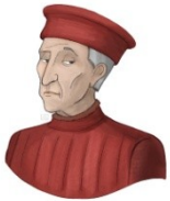
COSIMO IL VECCHIO DE' MEDICI

NELL'ANTICO EGITTO IL FARAONE TUTANKHAMON E ANKHESENAMON ERANO MARITO E MOGLIE . ANKHESENAMON DIVENNE "SPOSA REALE" DEL FARAONE TUTANKHAMON ALL'ETÀ DI 13 ANNI, MENTRE IL PICCOLO FARAONE AVEVA APPENA 8 ANNI.